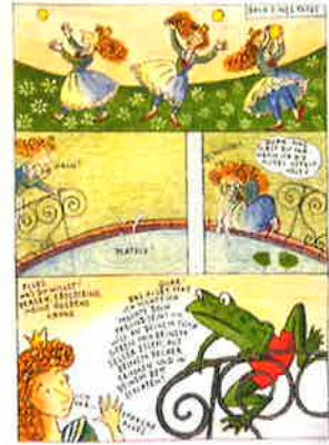
© Verlagshaus Jacoby & Stuart, Berlin 2008